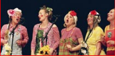
Die KlinikClowns in concert sind beim Regensburg-Marathon zu genießen, gratis und garantiert nicht außer Atem!