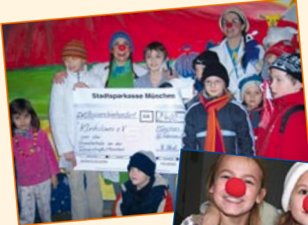
Links: Turnerschule. Wer ist jetzt wohl am meisten beschenkt? Mitte: Nikolausmarkt. Helfen macht Spaß. Natürlich sind die KlinikClowns mittendrin dabei! Rechts: Kiga-Kaufbeuren. Andächtig fürs Foto gruppiert.