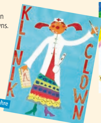
Annika, 10 Jahre

Doch eine Entscheidung musste getroffen werden, und so wurden die ersten Plätze in den verschiedenen Altersstufen – nicht ohne heiße Diskussionen – ermittelt.