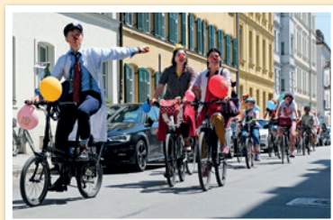
„Duda“ gibt die Richtung vor in München