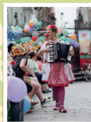
Radltour in Regensburg am 15.6.18