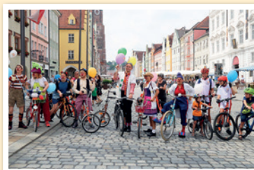
Radltour in Landshut am 9.6.18