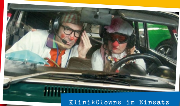
KlinikClowns im Einsatz

Neuigkeiten von KlinikClowns Bayern e.V. Nr. 26/März 2017