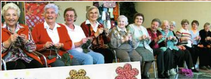
Wer will fleißige Strickerinnen seh'n? Der muss in die Diakonie am Hasenberg! geh'n!

des Strickprojektes, das Seniorinnen anlässlich des 40-jährigen Jubiläums der Diakonie Hasenberg