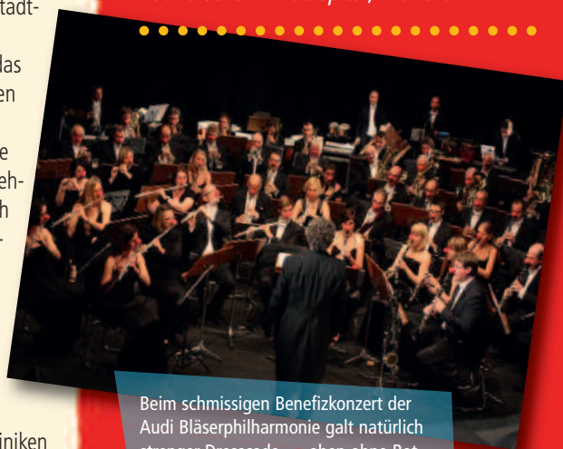
Beim schmissigen Benefizkonzert der Audi Bläserphilharmonie galt natürlich strenger Dresscode – »oben ohne Rot« war eher verpönt.

Die Audi Bläserphilharmonie gab Ende September im Weilheimer Stadttheater ein Benefizkonzert unter dem Titel »Filmträume«. Durch das Programm mit eigens arrangierten Nummern von Mary Poppins bis zum Fluch der Karibik führten die KlinikClowns, die es sich nicht nehmen ließen, ihrerseits musikalisch zum Gelingen des Abends beizutragen. Presse und Zuschauer waren begeistert und genossen einen traumhaften Abend. Herzlichen Dank an die Musiker und Unterstützer – die KlinikClowns können mit ihrer Hilfe Träume und Fantasie in Kinderkliniken und Seniorenheime bringen.